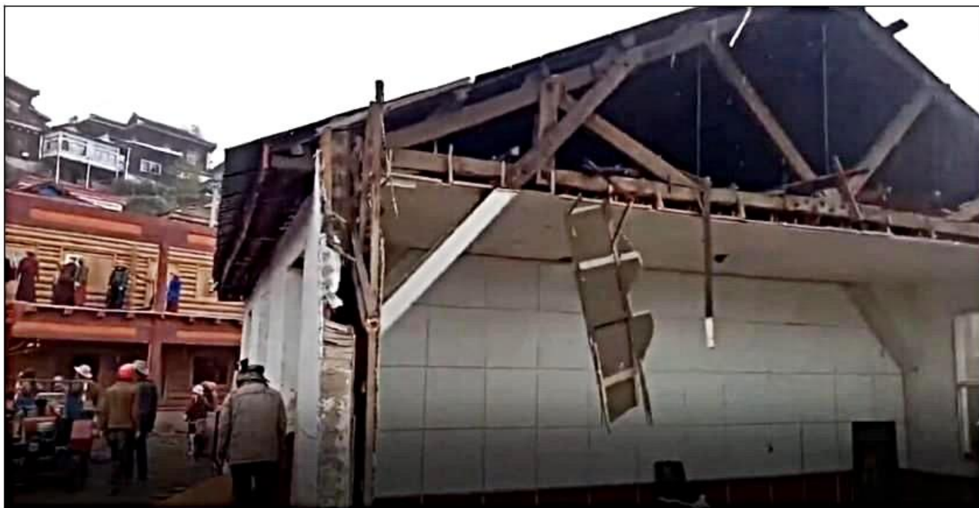
An image revealing the demolition of the monastery.

destruction de l'académie bouddhiste Larung Gar, au cours de laquelle des milliers de moines et de nonnes ont été expulsés et des maisons détruites. Plus tôt en novembre 2021, les autorités chinoises du comté de Drakgo (Ch : Luhuo) ont ordonné aux Tibétains de démolir une école bouddhiste tibétaine après avoir faussement allégué que l'école avait « violé la loi sur l'utilisation des terres », selon le journal Tibet Times.